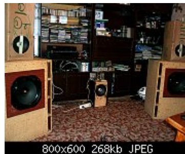
800x600 268kb JPEG