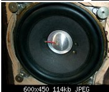
600x450 114kb JPEG