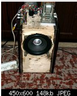
450x600 148kb JPEG