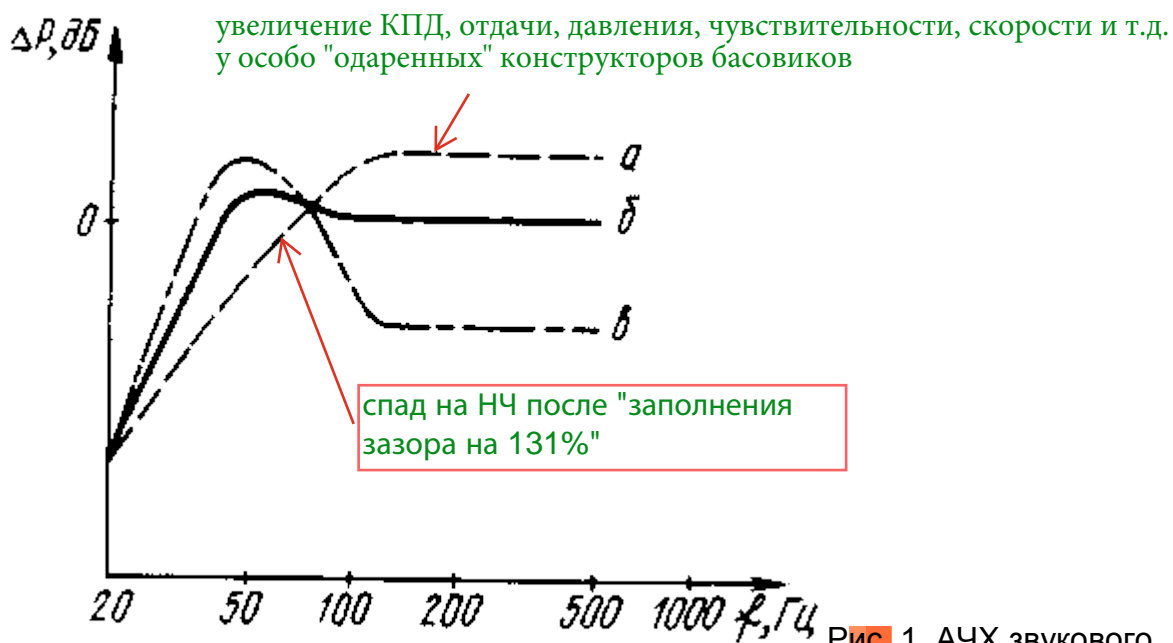
Рис. 1. АЧХ звукового давления динамика на частотах до 500 Гц.

На рис. 1 приведена частотная характеристика звукового давления головки на частотах до 500 Гц. По оси ординат отложено изменение отдачи динамика по сравнению с номинальной (кривая б).